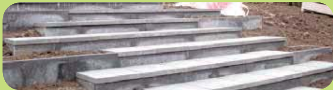
Stapsgewijs naar uw nieuwe tuin.

Als hoveniersbedrijf zijn we gespecialiseerd in het realiseren en onderhouden van tuinen. In deze zullen wij aan u onze werkwijze uitleggen hoe te komen tot een nieuwe tuin. Wilt u lezen hoe onze werkwijze is bij het tuinonderhoud, dan kunt u hier klikken .